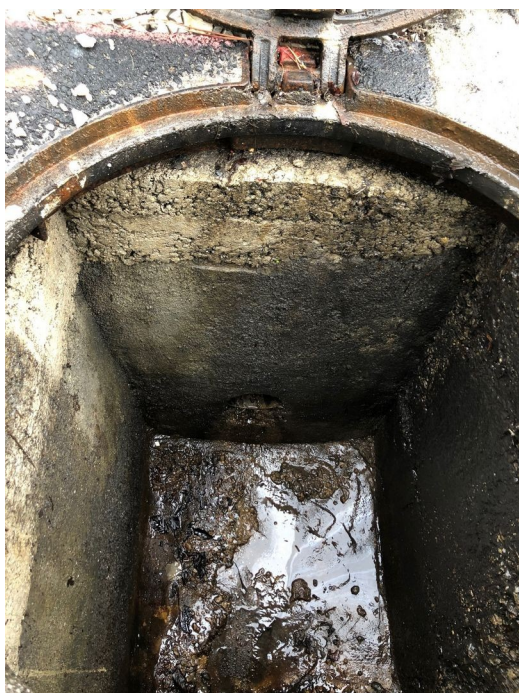
Regard n° 1 : Présence d'hydrocarbures en fond de regard.