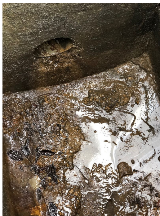
Regard n° 1 : Le tube en PVC ne déverse plus d'hydrocarbures. En revanche, des hydrocarbures s'écoulent d'une part, entre la jonction du tube PVC et la paroi béton du regard, et d'autre part, via la paroi du regard située en dessous du tube PVC (suintement par infiltration).