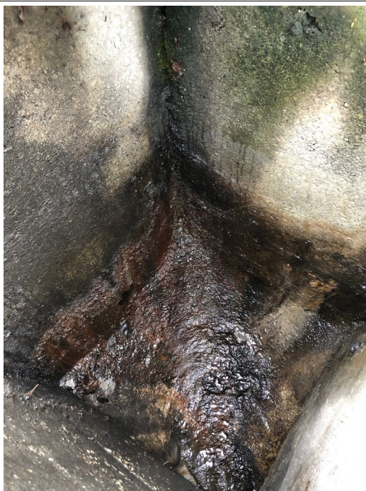
Regard n° 8 :

Suintement important d'hydrocarbure via la paroi béton du regard (infiltration).