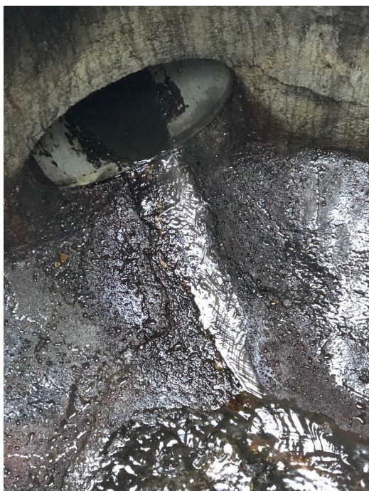
Regard n° 2 : Présence d'hydrocarbures en fond de regard et écoulement via la buse béton du réseau d'eaux pluviales. Par ailleurs, suintement d'hydrocarbures via la paroi béton du regard (infiltration).