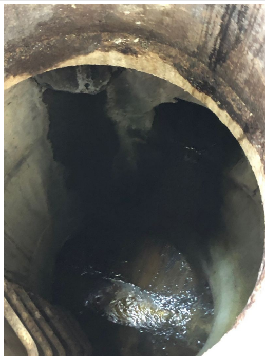
Regard n° 11 :

Suintement important d'hydrocarbure via la paroi béton du regard (infiltration).