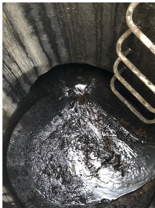
Regard n° 3 : Présence d'hydrocarbures en fond de regard.